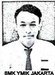
SMK YMIK JAKARTA