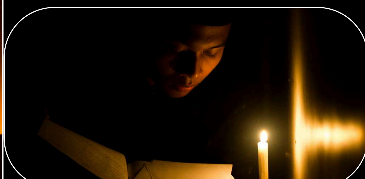
foto cerita tentang semangat santri Dalam mencari pengetahuan