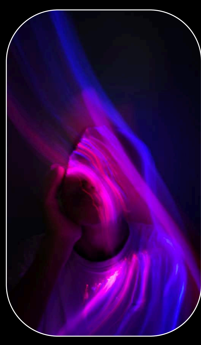
Foto light painting