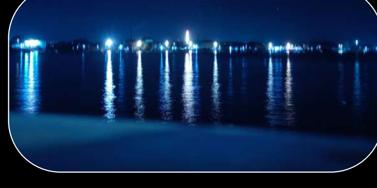
Saya fotografer yang gemar bereksperimen dalam berkarya